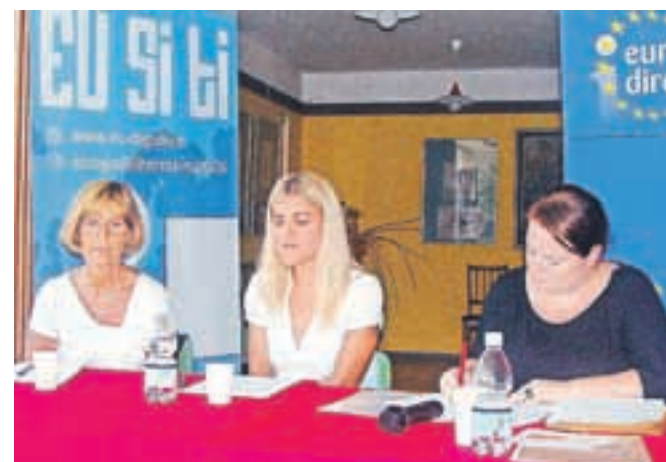
Tematski dan pri jeseniških upokojencih

Klemenc. Vodstvo krajevnosti je za vsakega izmed nagrajencev pripravilo manjša družinska presenečenja, prireditev pa se je zaključila s pogostitvijo in druženjem krajanov. Zaključek praznovanj praznika krajevnosti je bil v nedeljo na Pristavi v Javorniškem rovtu, kjer so pripravili družabno srečanje krajanov, zaval pa jih je Hajni Blagne.