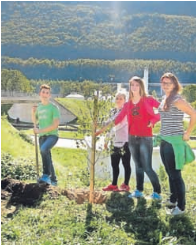
Dijaki so posadili dve brezi.