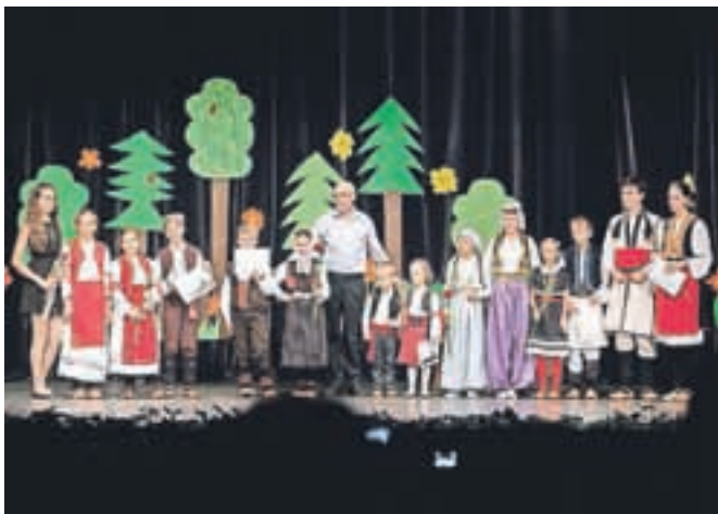
Nastopilo je šest otroških folklornih skupin bošnjaških, makedonskih in srbskih društev.