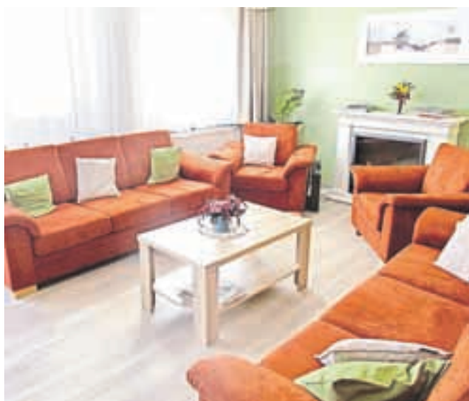
Dnevni prostor s kaminom