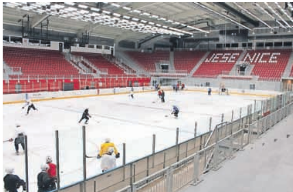
Dvorana Podmežakla je z ledeno ploskvijo spet dobila znano podobo, pri treningu smo ujeli ekipo Team Jesenice.

Jutri ob 18. uri Jeseničane čaka premierni nastop v INL ligi pred domačim občinstvom, z ekipo Ghardeina. Navijači, ki jim srce bije za igralce v rdečih dresih, znajo biti zelo kritični, a borbeno igro znajo še kako dobro prepoznati. Upajmo, da bodo tribune čim bolj polne. V nedeljo hokejiste čaka gostovanje v Zell am Seeju.