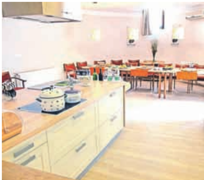
Lična kuhinja z jedilnico