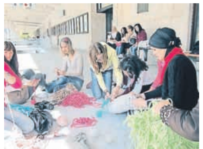
Na jeseniški železniški postaji so dekleta iz zavoda Oloop predstavile tehniko pletenja brez pletilk, na prste. Dogodek so poimenovali Skupna tla: srečanje pripadnic različnih etničnih skupin na skupnih tleh – na preprogi.