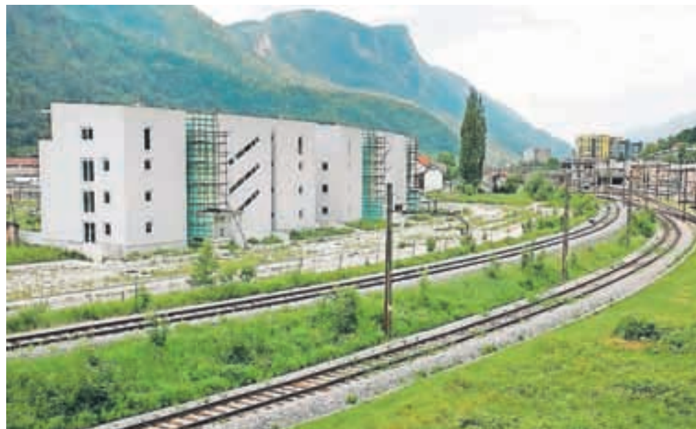
Aleasing ima sedaj še eno leto časa, da dokonča gradnjo v Hrenovci in zgradi prečno povezavo.