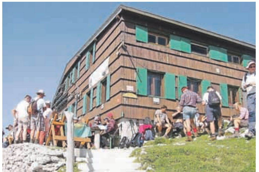
Prešernova kočja na Stolu, priljubljena točka planincev