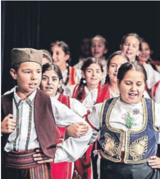
Otroška folklorna skupina KPŠD Vuk Karadžić