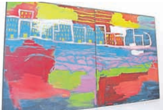
Ena od Jankovih umetnin