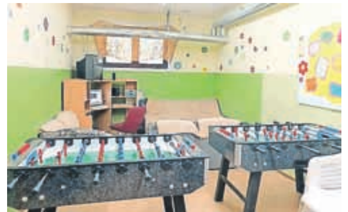
Dnevni center je namenjen druženju, otroci pa lahko dobijo tudi učno pomoč.